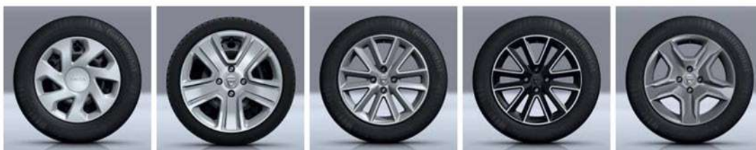
EMBELEZADOR DE RODA 15"